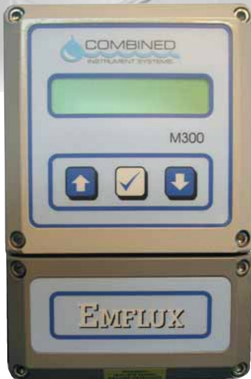
Emflux M300 Transmisor para caudalímetro